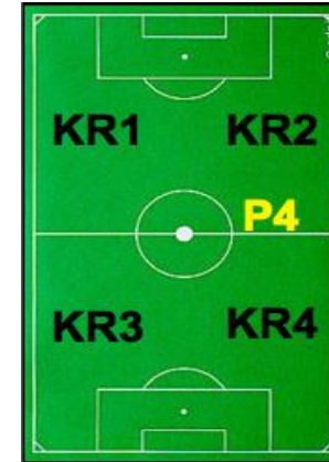
P4 - KUNSTRASEN