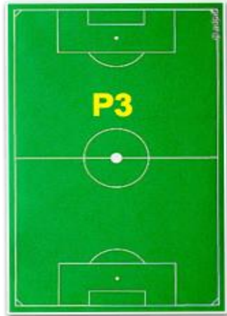
P3 - SANDPLATZ