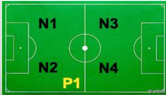
P1 - NEUER PLATZ