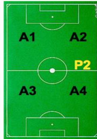
P2 - ALTER PLATZ